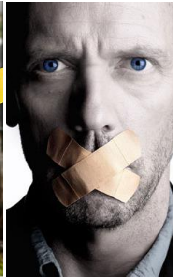
Comportamiento no verbal

10 horas de taller práctico e interactivo de tres módulos impartidos por forenses, especialistas en investigación criminal y análisis de conducta.