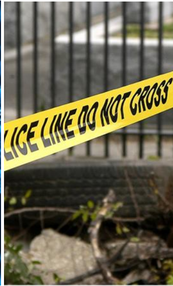
Escena del crimen